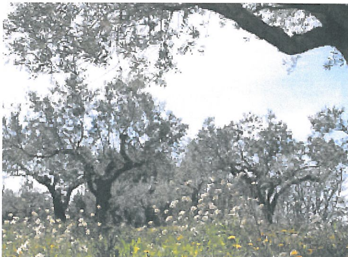
Tailler en couronne, les oliviers apportent de l'huile en suffisance.