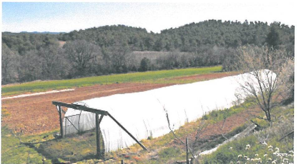
Du côté des herbages.