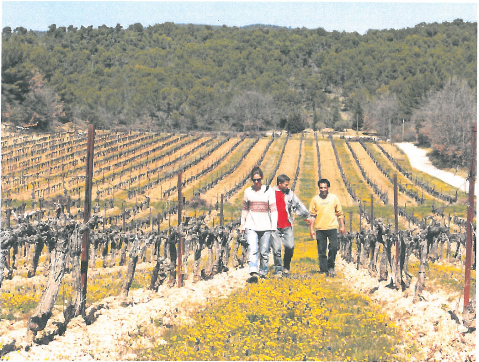
Dans la vigne, de retour de la taille des vigoureux ceps.