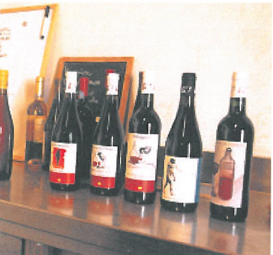
...bientôt, peut-être, chez nous en Suisse.